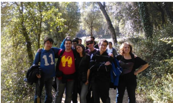
Poblat ibèric Puig Castellar