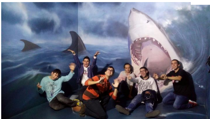
Museu de les Il·lusions de Barcelona