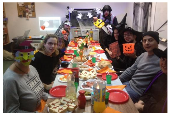
Festa de Halloween