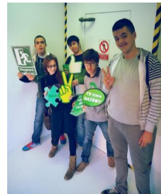
Room Escape "Cronològic"