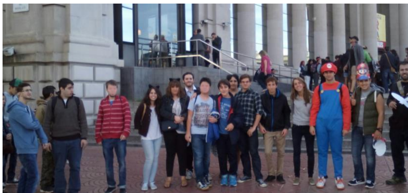
Saló del Còmic